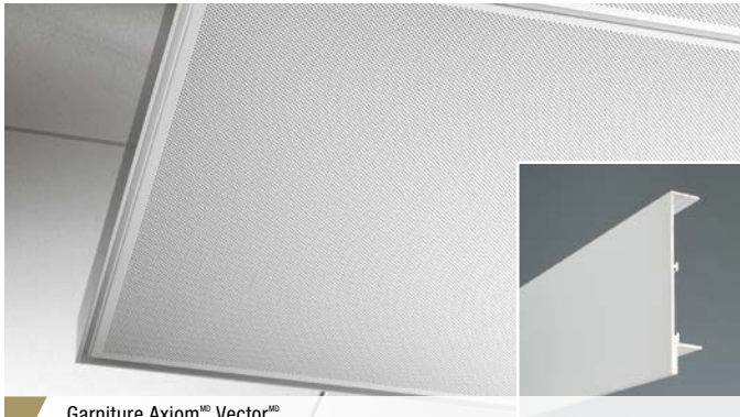
Garniture Axiom MD Vector MD

Cette garniture se coordonne parfaitement avec les panneaux de plafond Armstrong MD Vector MD pour donner l'impression d'un rebord apparent de 1/4 po avec profilé à aileron vertical et étroit.