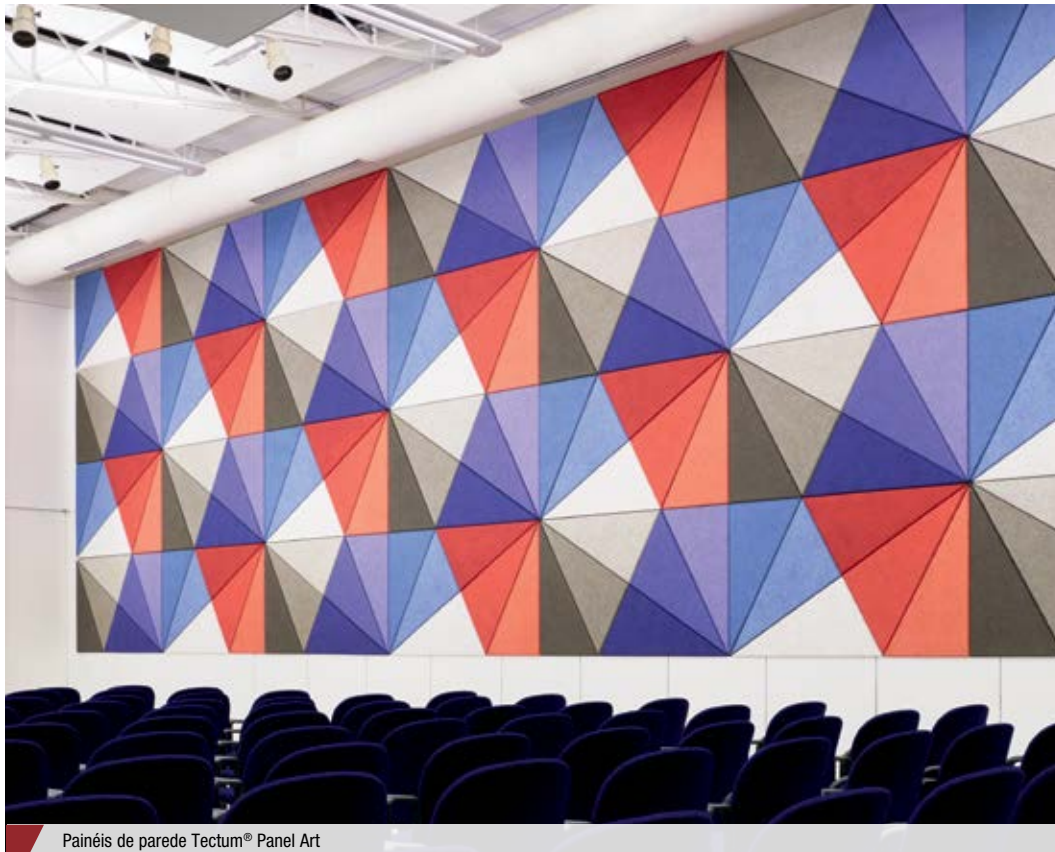
Painéis de parede Tectum® Panel Art

Declare™ Verificado por terceiros Certificação Living Product Imperative