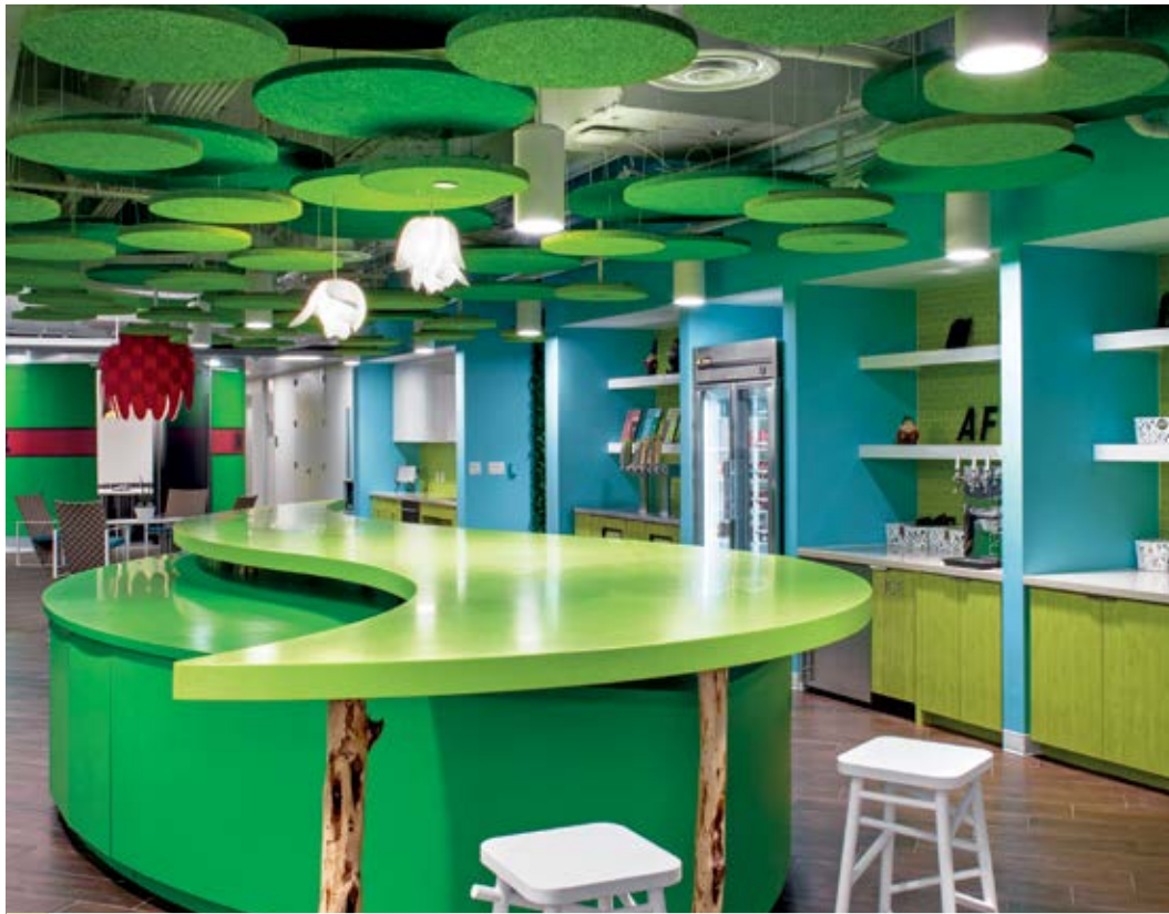
Nuvens em cores personalizadas Tectum®

As formas e nuvens Tectum® oferecem um sistema flutuante com flexibilidade de design e desempenho acústico.