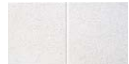
Plafón Second Look II – Grabacion cara cuadrados de 12" x 12" nominales