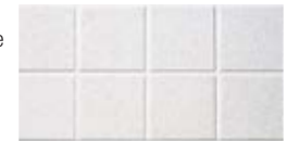
Plafón Second Look I – Grabacion cara cuadrados de 12" x 12" nominales