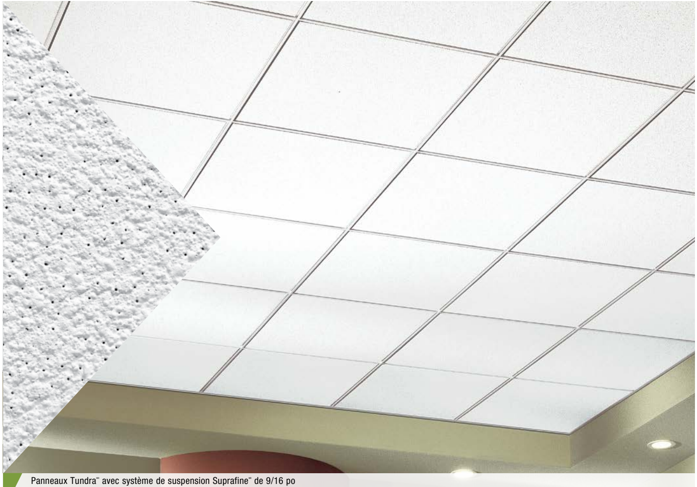
Panneaux Tundra MD avec système de suspension Suprafine MD de 9/16 po

Suspendu carré et tégulaire texture intermédiaire