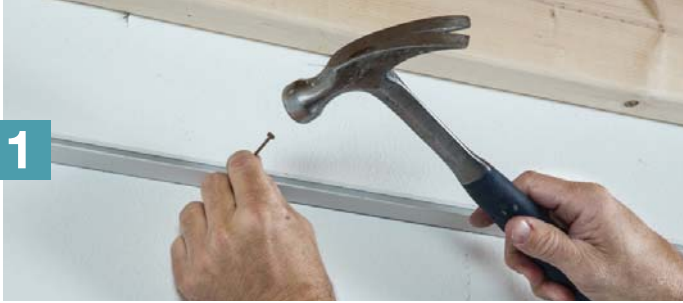
Installation de la moulure murale