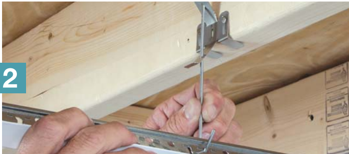
Suspendez les tés principaux au moyen de fils de suspension ou de la NOUVELLE quincaillerie QuickHang MC* (illustré ci-dessus : crochets et supports QuickHang)