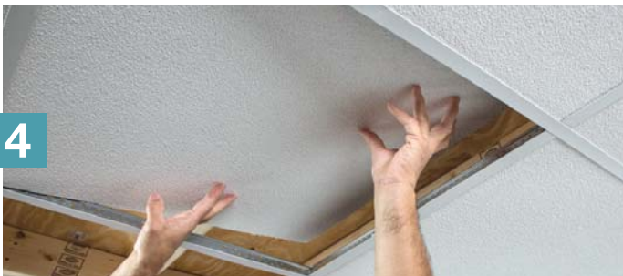
Installez les panneaux de plafond