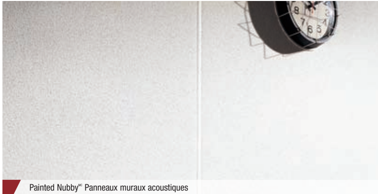
Painted Nubby TM Panneaux muraux acoustiques

Des panneaux muraux avec une surface brillante qui fournissent une excellente absorption sonore.