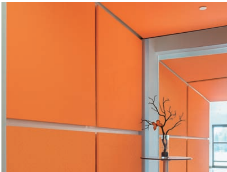
SoundScapes SM Formes Panneaux muraux 5440 et 5448 en Tangerine – mur supérieur et plafond; Soundsoak SM Panneaux muraux sur mesure en toile coordonnée – mur inférieur

Pour plus de renseignements, consultez les pages 95-98 ou visitez le site armstrongplafonds.ca/formes