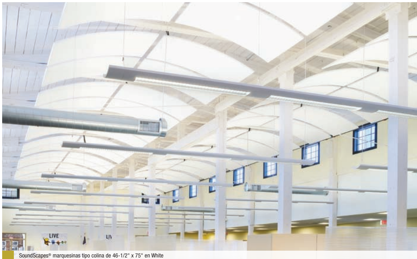
SoundScapes® marquesinas tipo colina de 46-1/2" x 75" en White

Estas marquesinas mejoran la acústica con una absorción puntual para definir los espacios.