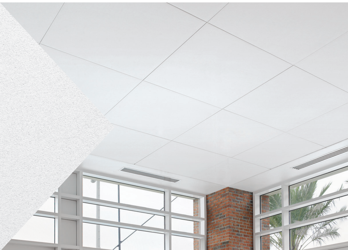
Panneaux Lyra Vector avec système de suspension Prelude XL de 15/16 po

Visuel lisse comme le gypse à retrait de 1/4 po et accès par le bas, idéal pour les projets où l'espace dans le faux plafond est limité. Offre une haute absorption acoustique.