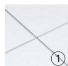
1. Panneaux Lyra MD Vector MD avec système de suspension Prelude MD XL MD de 15/16 po

Dessins CAO/Revit MD à : armstrongplafonds.ca/caorevit