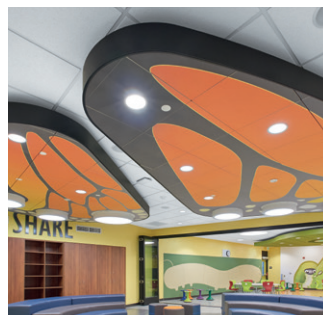
Panneaux Ultima Create! Vector avec système de suspension Prelude XL