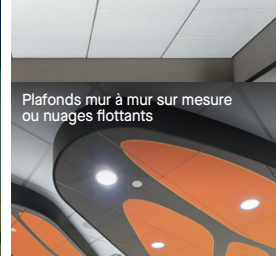
Plafonds mur à mur sur mesure ou nuages flottants