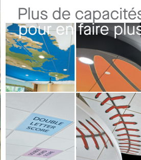
Plus de capacités pour en faire plus

armstrongplafonds.ca/capacités Plus de photos sur : armstrongplafonds.ca/galeriephotos