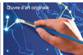
Œuvre d'art originale Panneaux de plafond Ultima, Ultima Health Zone Santé ou Optima