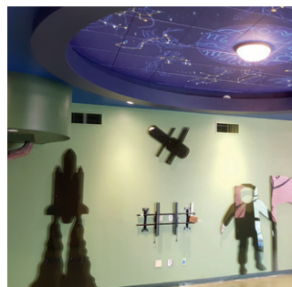
Panneaux Ultima Create! personnalisés avec système de suspension Prelude XL