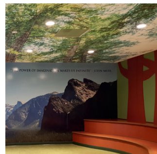
Panneaux Ultima Create! personnalisés avec système de suspension Prelude XL

TechLine 877 276-7876 armstrongplafonds.ca/create