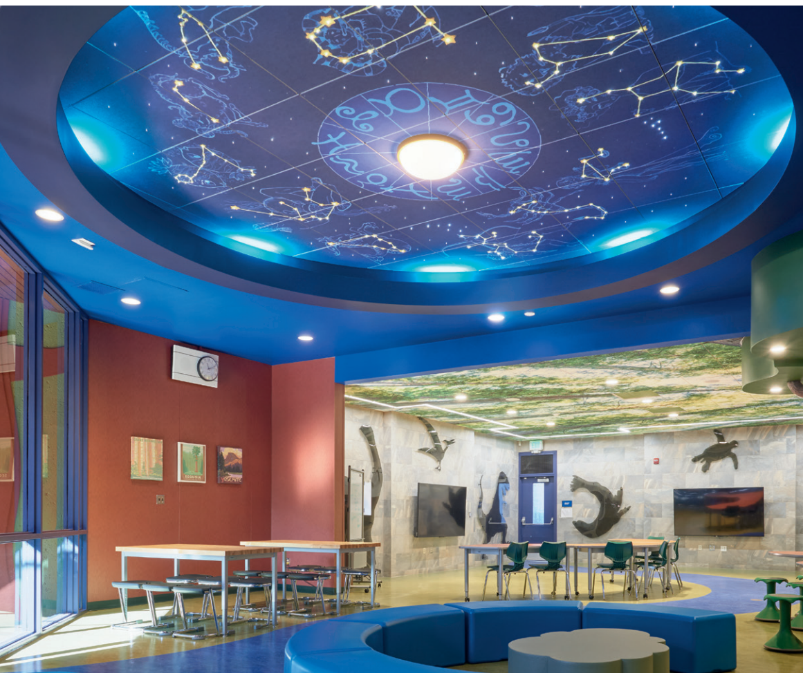
Ultima Create! Panneaux Vector avec système de suspension Prelude XL 15/16 po