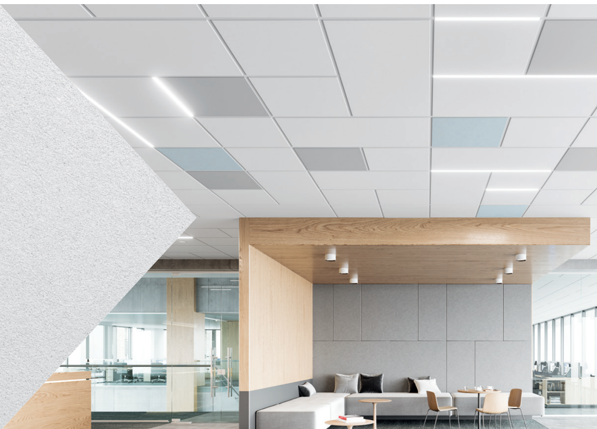
▲ Panneaux réguliers carrés Calla Health Zone avec système de suspension Suprafine MD de 9/16 po

SUSTAIN MD Systèmes performants pour le développement durable