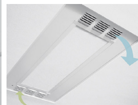
S'intègre parfaitement avec les plafonds AcoustiBuilt pour améliorer la qualité de l'air

Le système VidaShield UV24 MC d'Armstrong combine un purificateur d'air à UV-C à des panneaux de plafond coordonnés ou un éclairage à DEL pour purifier l'air en toute sécurité et de manière discrète directement dans la pièce.