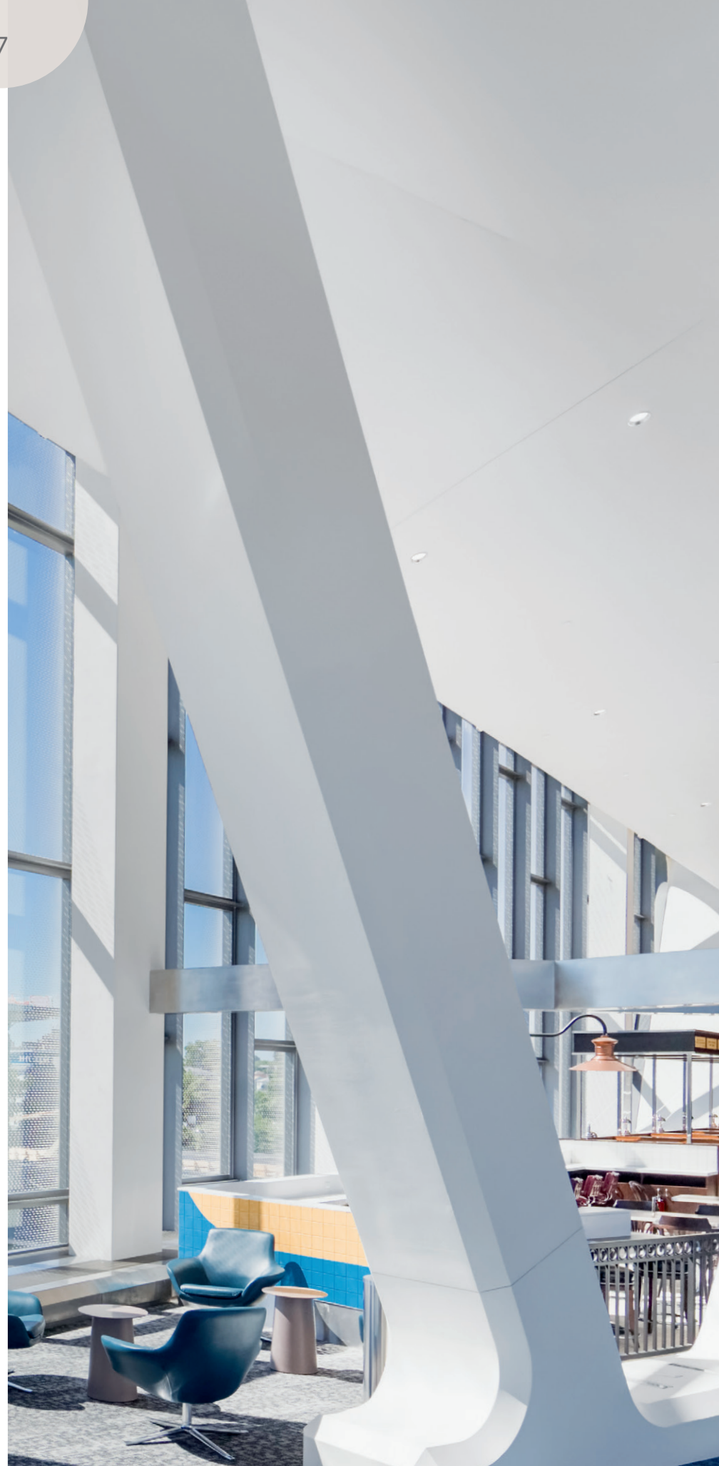
GRV et BRFV