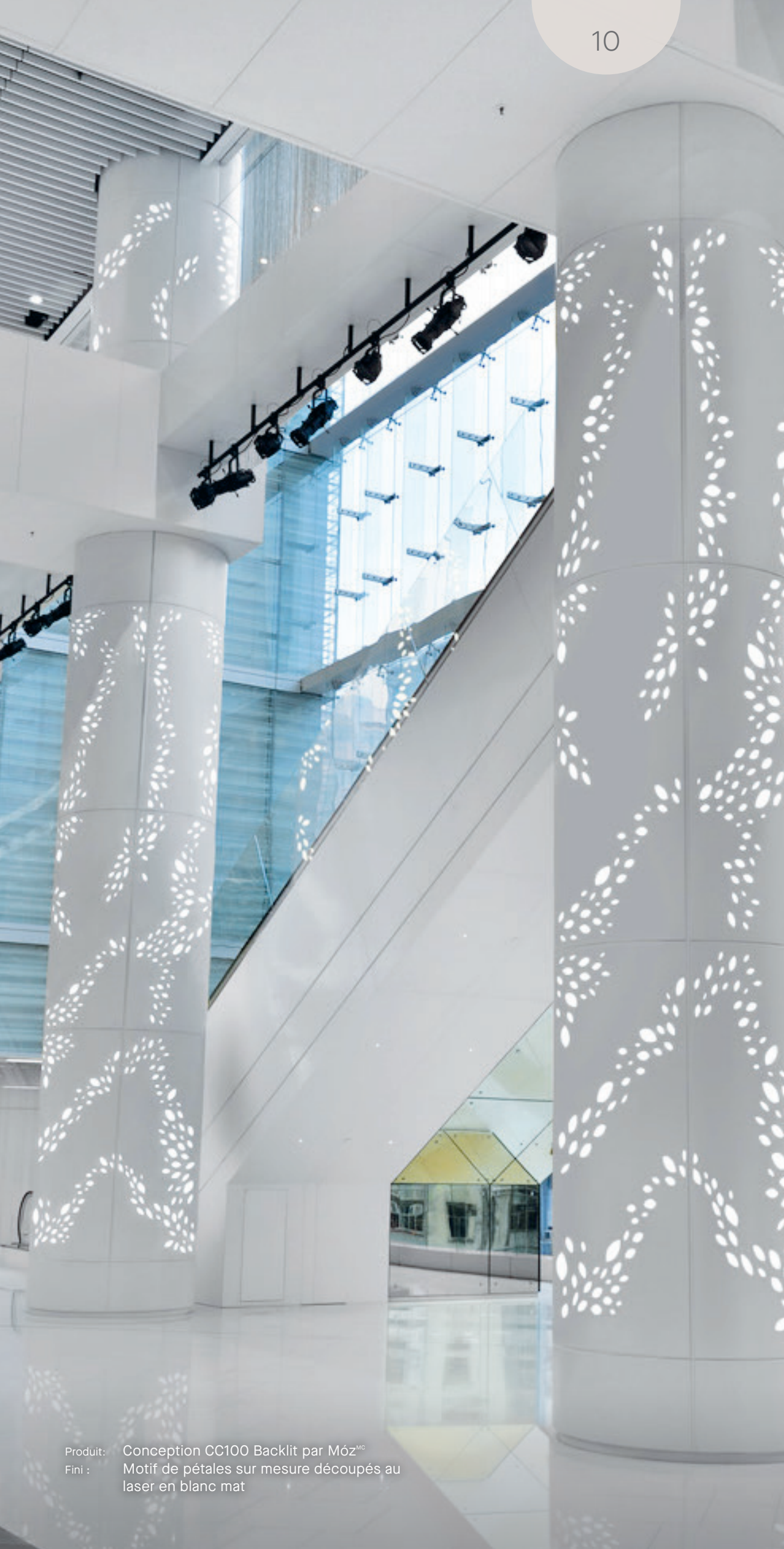
Produit : Conception CC100 Backlit par Móz MC Fini : Motif de pétales sur mesure découpés au laser en blanc mat