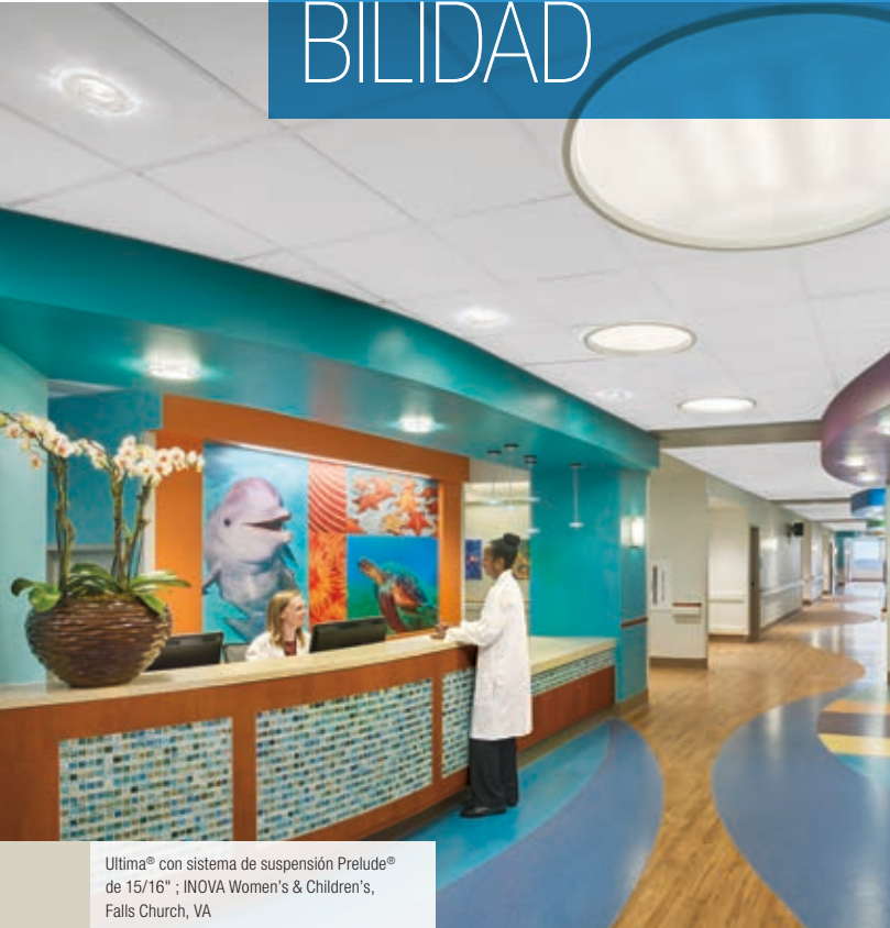
Ultima® con sistema de suspensión Prelude® de 15/16" ; INOVA Women's & Children's, Falls Church, VA