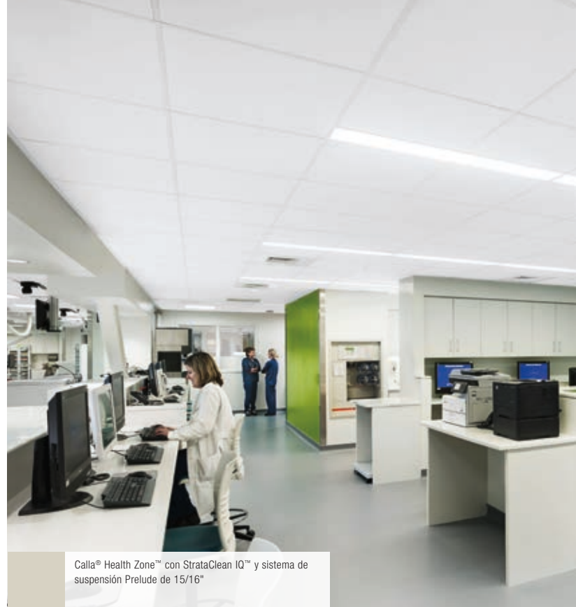
Calla® Health Zone™ con StrataClean IQ™ y sistema de suspensión Prelude de 15/16"