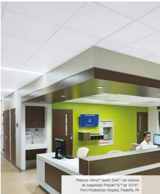
Plafones Ultima® Health Zone™ con sistema de suspensión Prelude® XL® de 15/16"; Penn Presbyterian Hospital, Filadelfia, PA

Estos espacios híbridos requieren cielos acústicos multifuncionales. Los criterios clave en estos espacios incluyen la absorción y bloqueo del sonido, la reflectancia lumínica y las superficies resistentes al agua que sean fáciles de limpiar para prevenir las infecciones. Los plafones con desempeño Total Acoustics® brindan la combinación ideal de absorción y bloqueo del sonido en un solo sistema de plafón.