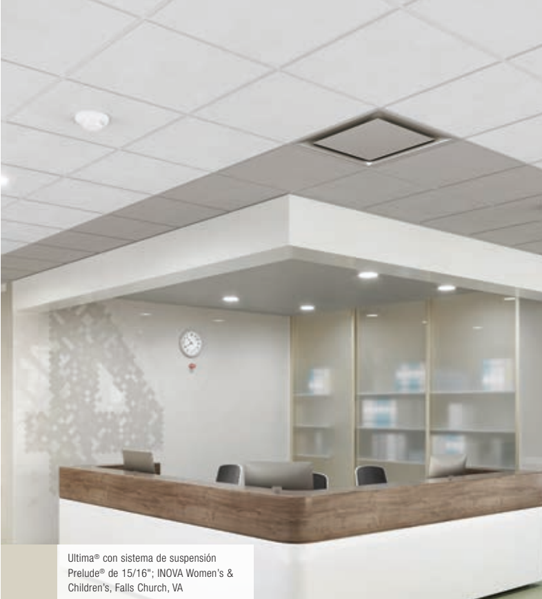
Ultima® con sistema de suspensión Prelude® de 15/16"; INOVA Women's & Children's, Falls Church, VA