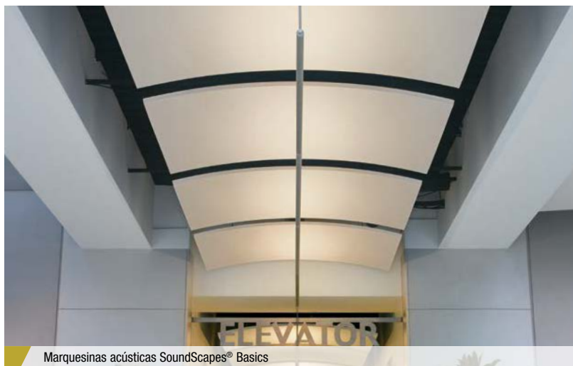
Marquesinas acústicas SoundScapes® Basics

Las marquesinas SoundScapes® Basics resuelven los desafíos del ruido y ofrecen absorción puntual.