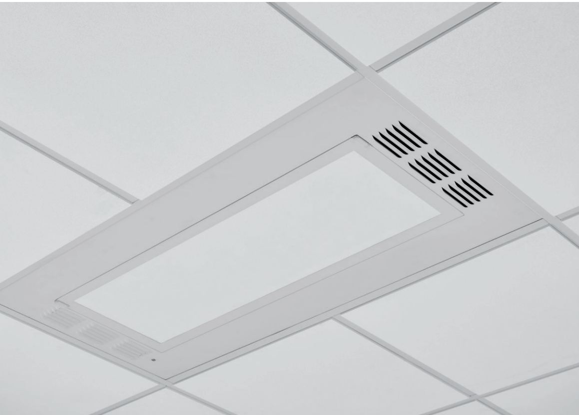
VidaShield UV24 Sistema para Ultima Health Zone

24/7 DEFEND™ Soluciones para espacios más saludables y seguros