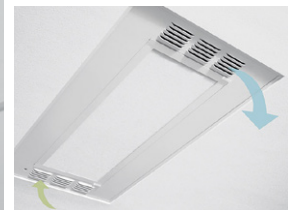
Se integra perfectamente con los plafones AcoustiBuilt para mejorar la calidad del aire

El sistema VidaShield UV24™ de Armstrong combina un purificador de aire UV-C con plafones coordinados o iluminación LED para ofrecer una purificación del aire en la habitación segura y discreta para un aire más limpio.