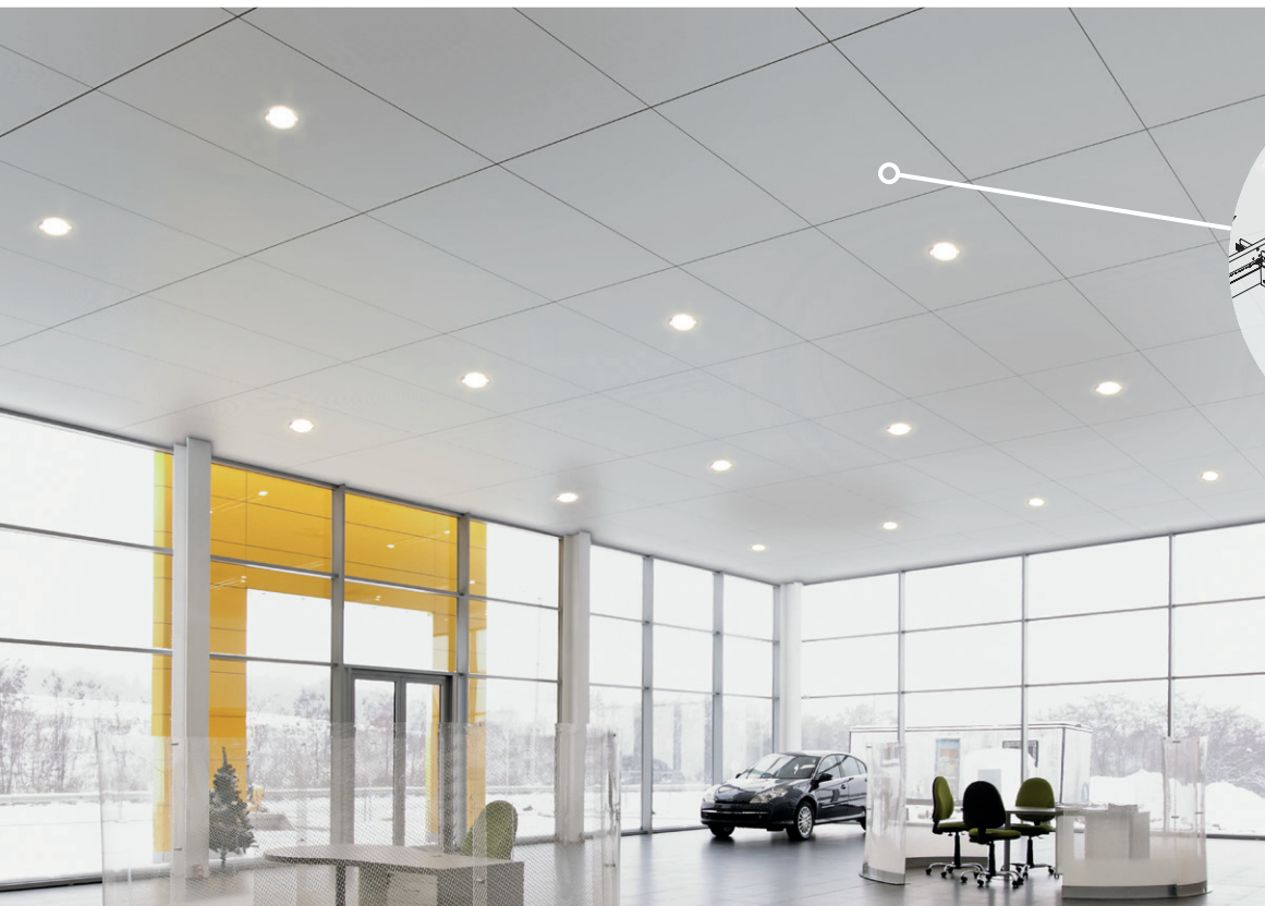
MetalWorks™ Plafones ocultos de 48" x 96" en gris plata

Dibujos CAD/Revit® armstrongceilings.com