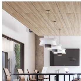
Plafones cuadrados Lyra de orilla cuadrada con sistema de suspensión Prelude 15/16"

Ahora disponible en visuales con aspecto de madera