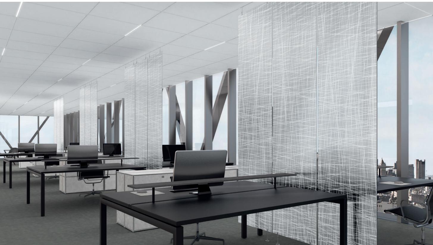
Infusions Particiones resilientes en Twine Trails

Ayudan a manejar el distanciamiento y la desdensificación