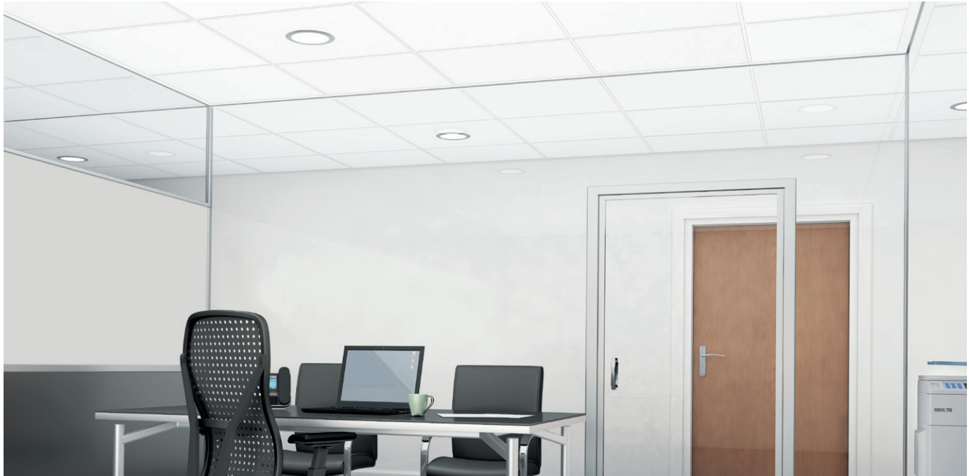
Borde Axiom® Glazing Channel para tabiques de cristal

SUSTAIN™ Sistemas de plafones sustentables de alto desempeño