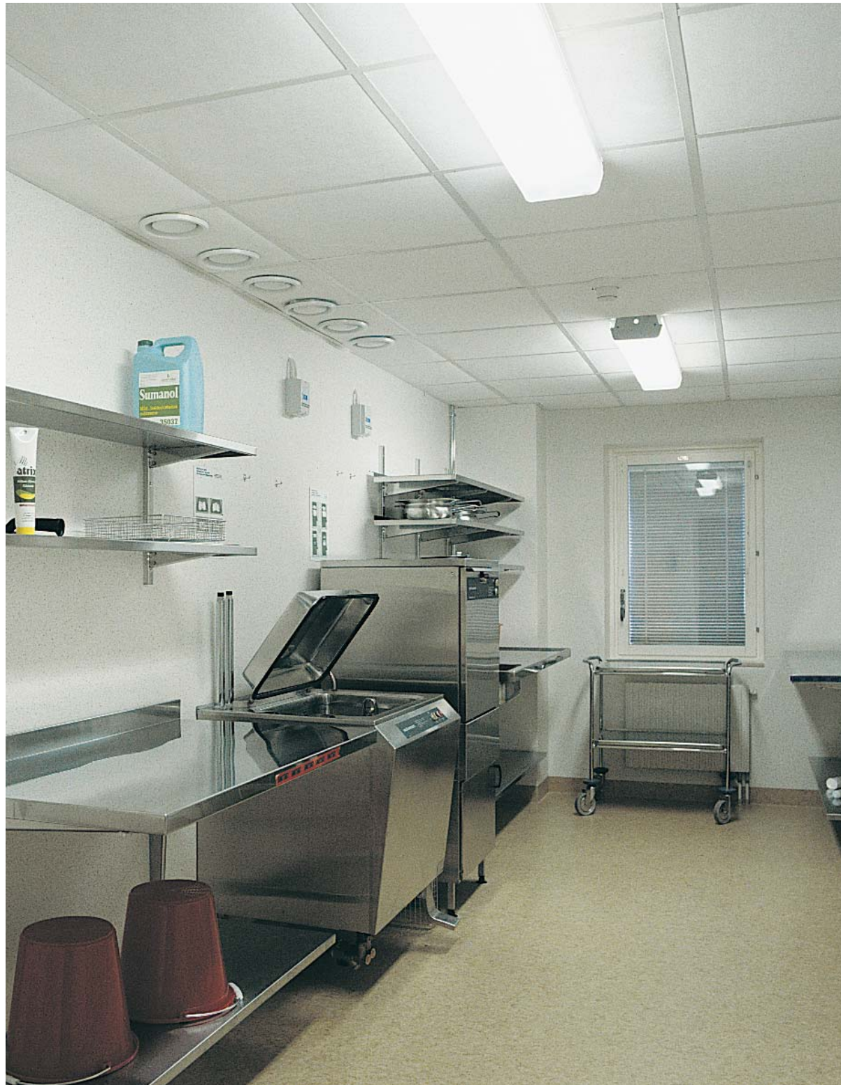
Parafon Hygien Board