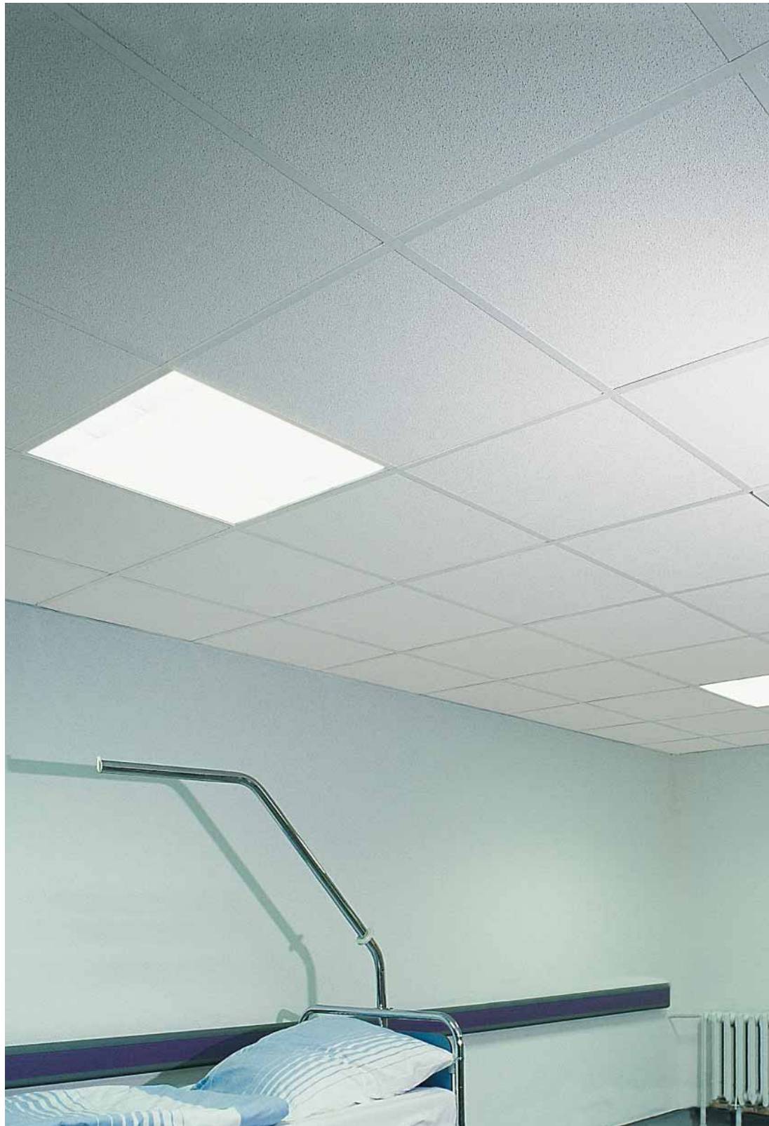
Bioguard Plain Board