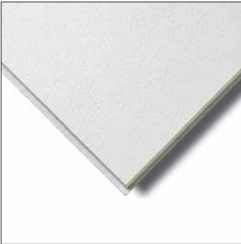
▲ Bioguard Plain